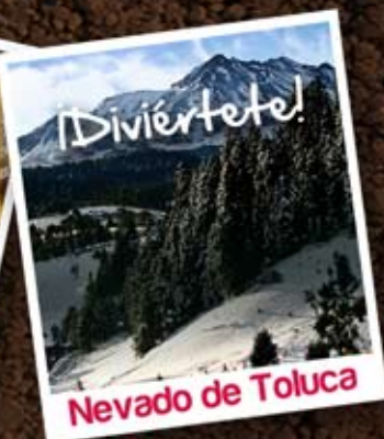
Nevado de Toluca