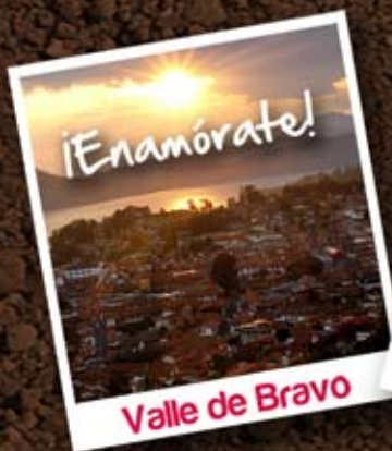
Valle de Bravo