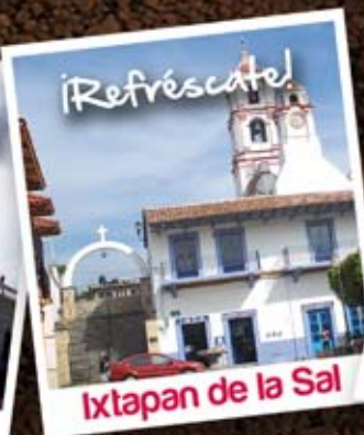
Ixtapan de la Sal