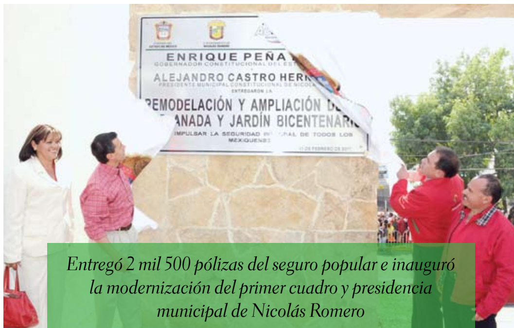
Entregó 2 mil 500 pólizas del seguro popular e inauguró la modernización del primer cuadro y presidencia municipal de Nicolás Romero

Ante cerca de 5 mil habitantes, expresó que con esta acción se garantiza el servicio para quienes no están integrados a al-