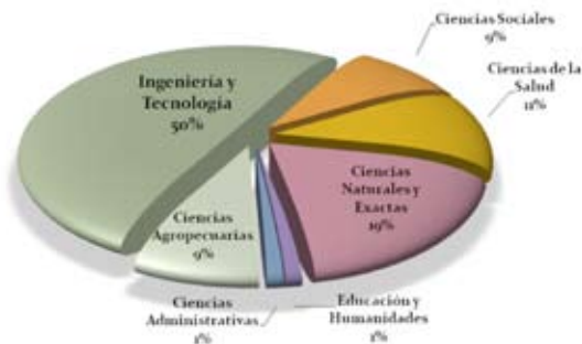
PROPORCIÓN DE BECAS OTORGADAS EN 2009 POR ÁREA DEL CONOCIMIENTO