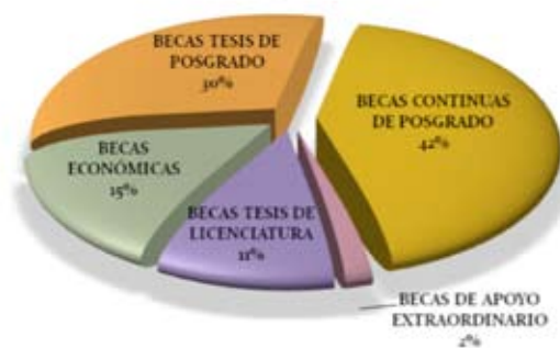
Proporción de Becas Otorgadas en el periodo 2005-2010

Como este caso hay muchos más en el Estado de México. El Consejo Mexiquense de Ciencia y Tecnología ofrece diversas modalidades de becas: Becas Continuas de Estudios de Posgrado, Becas de Apoyo Extraordinario, Becas Tesis de Licenciatura y Becas Tesis de Posgrado, todas ellas en áreas científicas y tecnológicas.